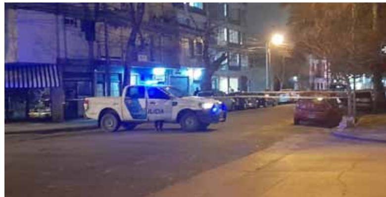
Motochorros. Un hombre y su pareja fueron sorprendidos en la intersección de las calles 11 de Septiembre y Salta

El hombre herido fue trasladado al Hospital Interzonal General de Agudos (HIGA), donde los médicos le realizaron las curaciones y dispusieron que permaneciera internado en observación. En tanto, personal de la comisaría primera realizó los peritajes co-