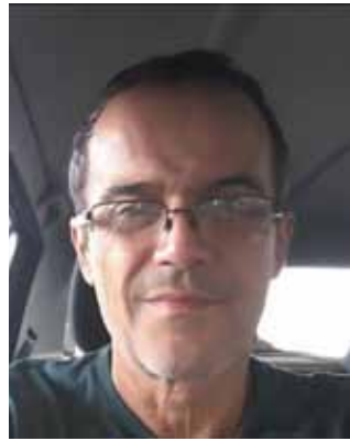
Colaboración Lic. Roberto D'Alessandro.

Los frenéticos acuerdos de último momento que definieron el cierre de listas para las elecciones legislativas de 2025 en Buenos Aires fueron mucho más que mero teatro político. Fueron un síntoma claro de una profunda y creciente desconexión entre la clase política argentina y una sociedad que la percibe cada vez más lejana y ensimismada. Lo que se vivió en la provincia no fue solo un