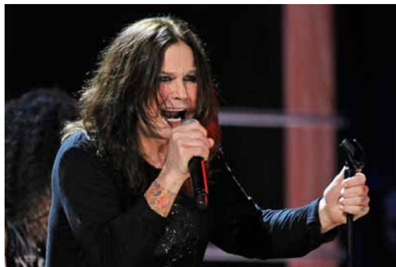
Heavy metal. Osbourne fue un pionero que marcó al género.

El álbum debut homónimo de Black Sabbath de 1969 ha sido comparado con el Big Bang del heavy metal. Surgió durante el apogeo de la Guerra de Vietnam y arruinó la fiesta hippie, revelando