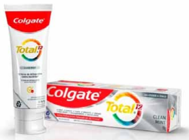
Retiro de unidades. Es una crema dental muy popular.

todas las unidades en ese país. En línea con esas acciones, ANMAT decidió aplicar la misma medida en Argentina para ese producto que viene del vecino país.