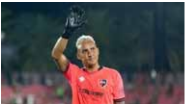
Despedida. Para el costarricense.

Navas agregó: "Si llegué a Newell's fue porque Dios así lo quiso, viví y luché por los colores de este club como lo he hecho por todos los escudos que en mi carrera deportiva me ha tocado defender".