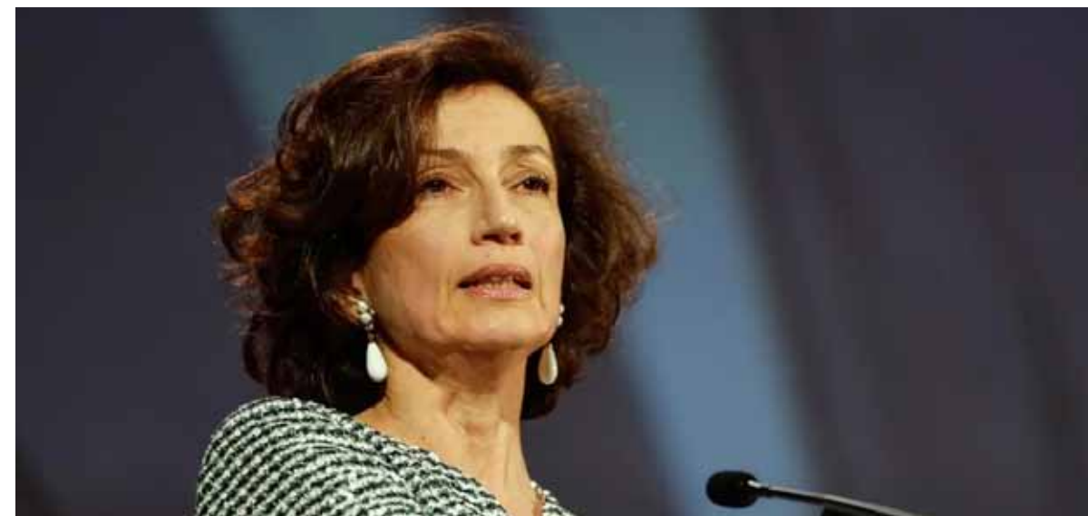
Anuncio. La portavoz del Departamento de Estado, Tammy Bruce, fue la encargada de comunicar la decisión.

"El secretario general lamenta profundamente la decisión de Estados Unidos de retirarse una vez más de