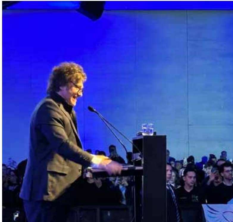
Efusivo. Así se mostró el Presidente quien pidió a sus seguidores “dar un batacazo violeta” en las elecciones.