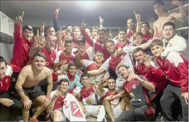
Primera celebración del año para el elenco pirovanense, nada menos que luego de enfrentar al campeón del Interligas.

La Liga de fútbol local llevó adelante la segunda fecha de su Torneo Apertura para Primera y Reserva el pasado domingo. En el transcurso de la jornada, se dio el dato significativo que el propio club Deportivo Pirovano calificó como “histórico”, y fue su