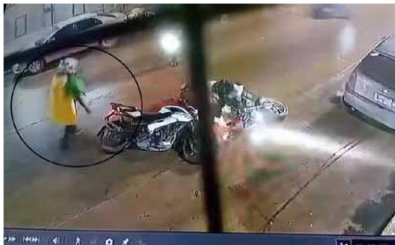
Ataque. El joven repartidor se defiende con una bolsa con productos de limpieza. (Captura de video)

Hace una semana en Ingeniero Budge, un policía federal hirió a un delincuente de 19 años que, junto con tres cómplices, intentó asaltarlo a mano armada. (DIB)