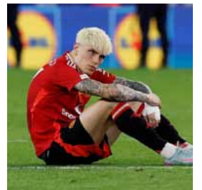
Sin lugar. Garnacho fue marginado por el entrenador Ruben Amorim.

Pese a sus cifras positivas en la temporada pasada (10 goles y 11 asistencias en 58 encuentros oficiales) el atacante argentino fue marginado por el entrenador Ruben Amorim, con quien sostuvo una relación conflictiva durante el curso.