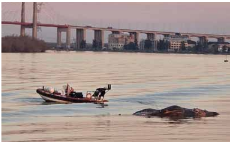
Otro ejemplar. Hace una semana había sido encontrada una ballena en Costanera Norte y primero una en Vicente López.

Pero unos días antes, el 9 de julio, se había encontrado otro ejemplar muerto sobre la costa de Vicente López. (DIB)