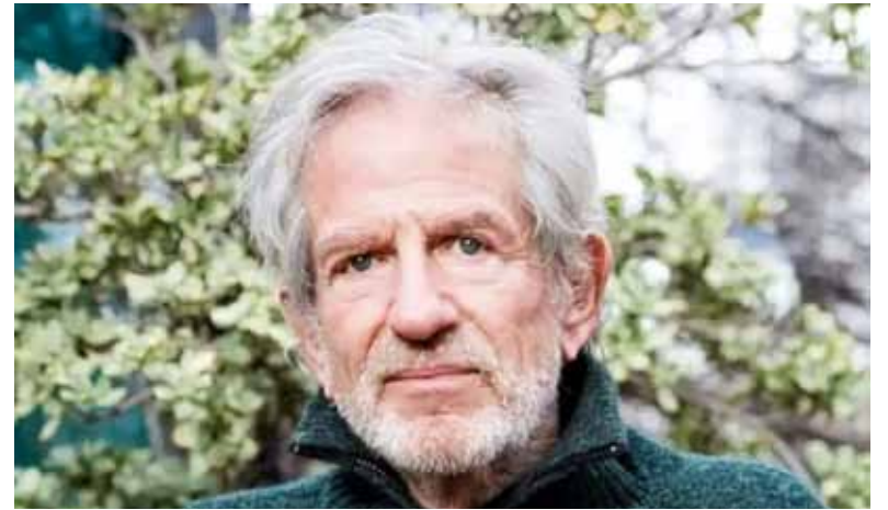
Susto. Fue el que se llevó el actor de 78 años que no sufrió lesiones graves.

Según el parte policial, personal de la Comisaría Vecinal 15A llegó al lugar alertado de que un auto perdiera el control y chocara contra otros vehículos estacionados. Los agentes constataron que el